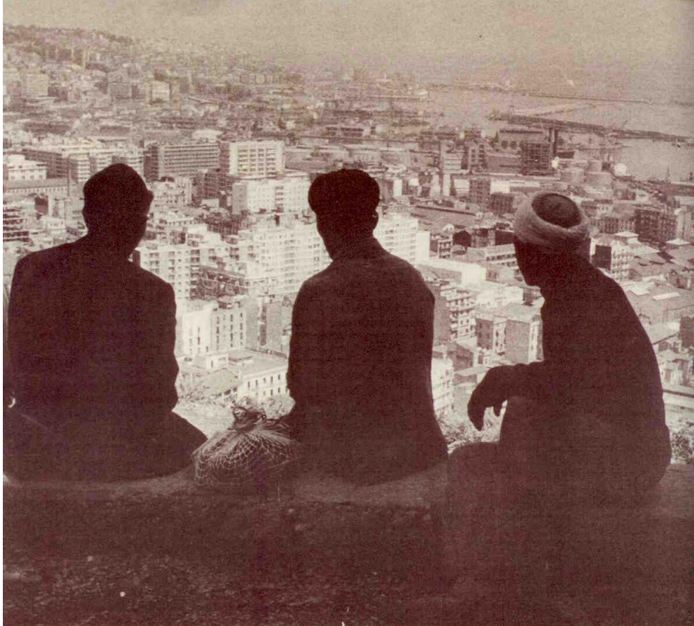
Afb. 1: foto bij het artikel van generaal André Zeller, fotograaf en datum onbekend.

tegenstander was van de onafhankelijkheid en die in het artikel de ruimte krijgt om uit te leggen dat de dekolonisatieoorlog mede was ingegeven door een ideaal 14 , toont Historia Magazine dat de bewustwording van het kolonialisme binnen de redactie nog niet heeft plaatsgevonden. Veel artikelen zijn nog doordrongen van een koloniale ideologie.